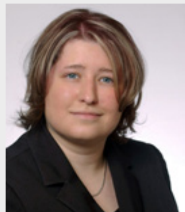
Liebe Bürgerin, Lieber Bürger,

In der darauf folgenden Zeit wurde die Verwaltung des WARL immer wieder aufgefordert, die Beitragskalkulation für das gesamte Verbandsgebiet transparent offen zu legen, da diese die Grundlage für die Beitragshöhe ist. Hierbei kam heraus, dass die vom WARL bis dahin erhobenen Beträge - bei einer voll umfänglichen Veranlagung im Verbandsgebiet - zu einer Überdeckung der zu erwartenden Kosten geführt hätten und schon aus diesem Grund unzulässig wären! Natürlich geht eine Beitragskalkulation mit einem in die Zukunft gerichteten Planungshorizont immer von gewissen Annahmen aus. Dies war auch bis zuletzt Streitpunkt zwischen der Amtsleitung des Verbandes und den Verbandsgemeinden untereinander, denn wenn die beschlossenen Beiträge für die zukünftigen Investitionen nicht auskömmlich sind, müssen die Fehlbeträge über steigende Gebühren kompensiert werden. Aus Sicht der Stadt sind Beitragssätze von 35 % (0,63 € für den Wasseranschluss und 1,47 € für den Abwasseranschluss) auskömmlich. Dies war aber in der Verbandsversammlung den Vertretern der anderen Gemeinden nicht zu vermitteln. Daher bleiben die nun beschlossenen Beiträge das, was sie sind: ein Kompromiss für alle und bezogen auf die Ausgangssituation ein Erfolg für Ludwigsfelde und die Bürgerinnen und Bürger im Verbandsgebiet!